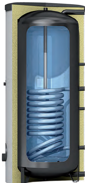
Typ RS mit eingebautem Glattrohrwärmetauscher