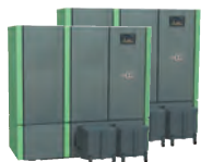
Bild zeigt 2x HDG Compact 65 Ausführung links inkl. Entschungssystem