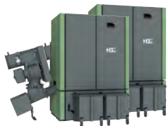
Bild zeigt 2x HDG Compact 65 Ausführung links inkl. Entschungssystem